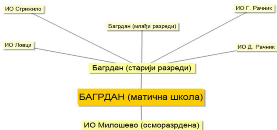
Слика 1: Шематски приказ структуре ОШ „Јоца Милосављевић“ у Багрдану